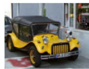
Abholung vor Ort

Unser Service im Autoschalter: Sie bleiben sitzen, wir versorgen und beraten Sie. Vollkommen barrierefrei.