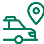
Zustellung per Botendienst

Unser Service im Autoschalter: Sie bleiben sitzen, wir versorgen und beraten Sie. Vollkommen barrierefrei.