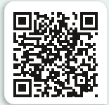
VitaFit Apotheke am Krankenhaus