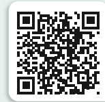
Apotheke im Gesundheitszentrum